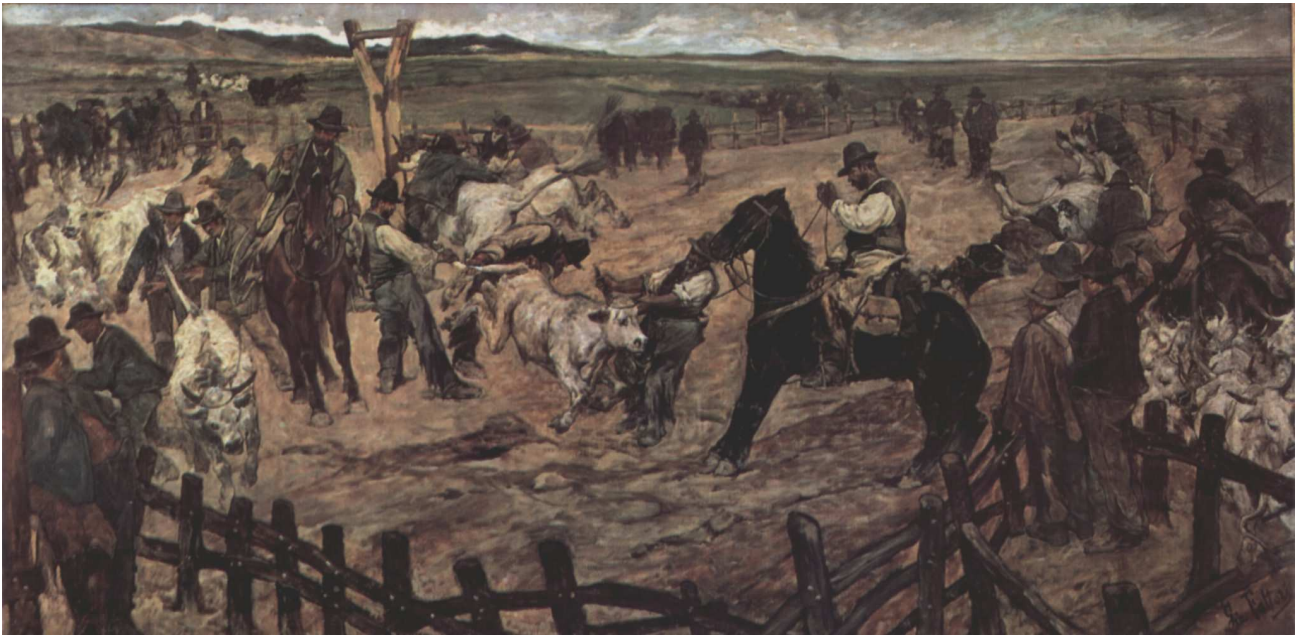
Giovanni Fattori-Marcatura dei torelli in Maremma-c.a.1885-1890 Coll.privata Genova