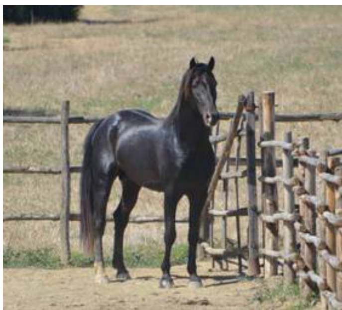
M.ENIGMA DELLA TRAPPOLA