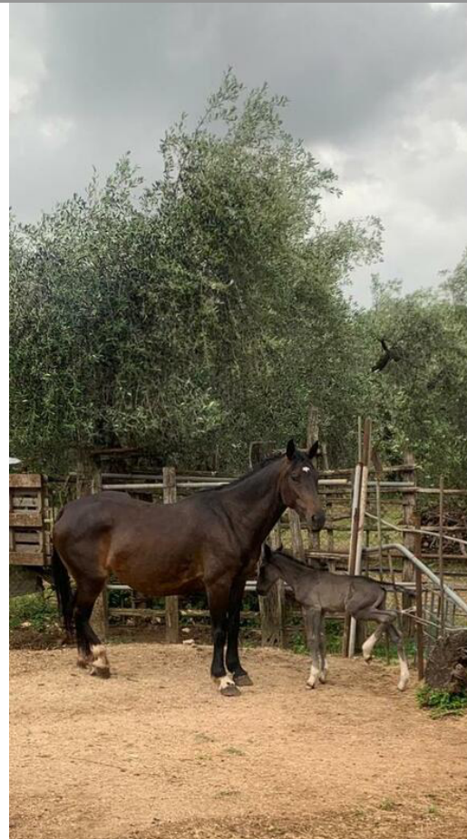
M.IPERICA DEL TALOZZO