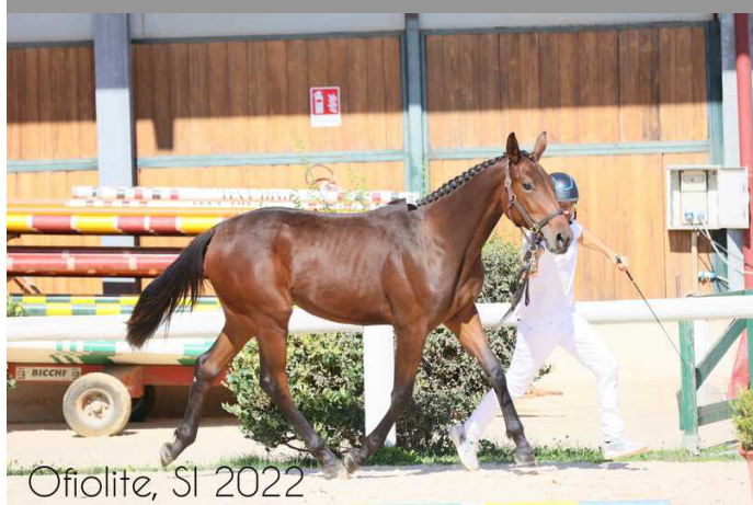
Ofiolite, SI 2022