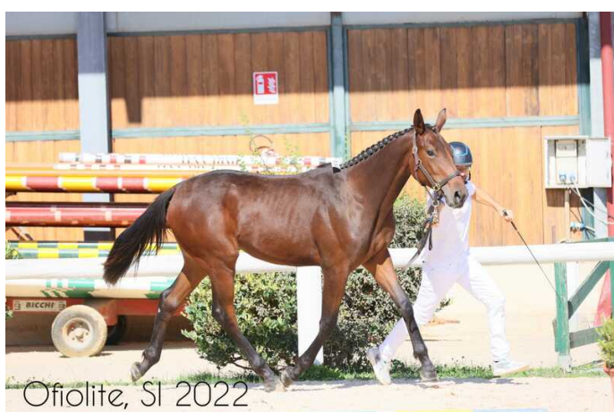
Ofiolite, SI 2022