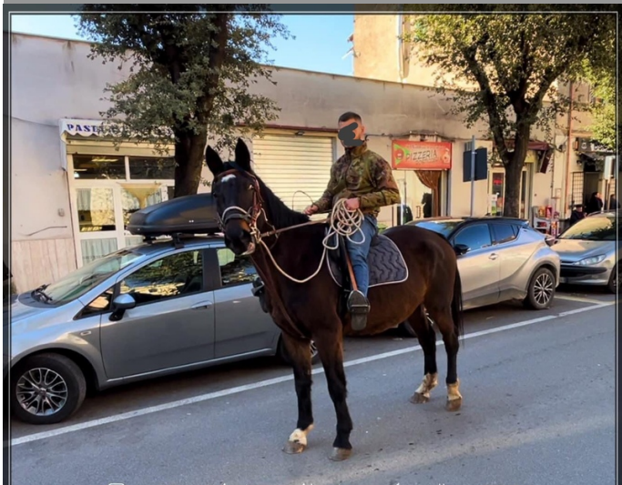
M.IPERICA DEL TALOZZO