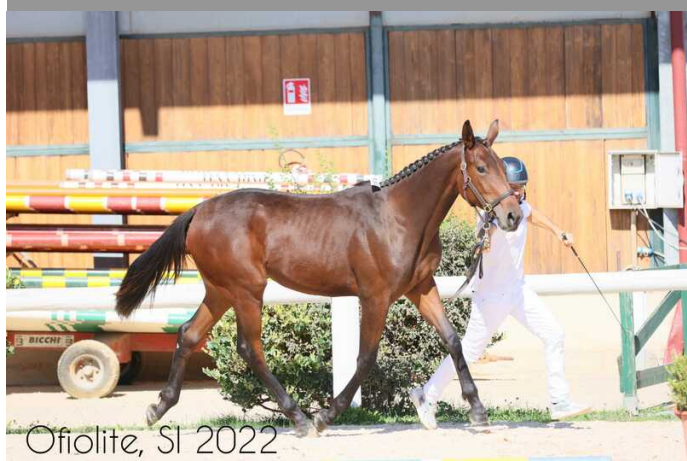
Ofiolite, SI 2022