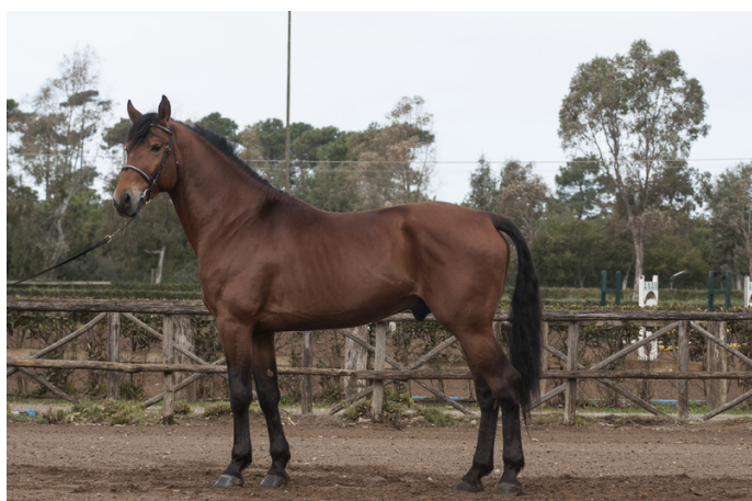
M.EZIO DI ROCCARESPAMPANI