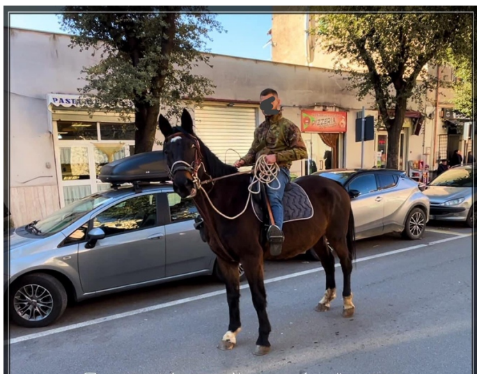
M.IPERICA DEL TALOZZO