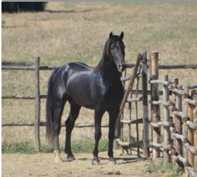
M.ENIGMA DELLA TRAPPOLA