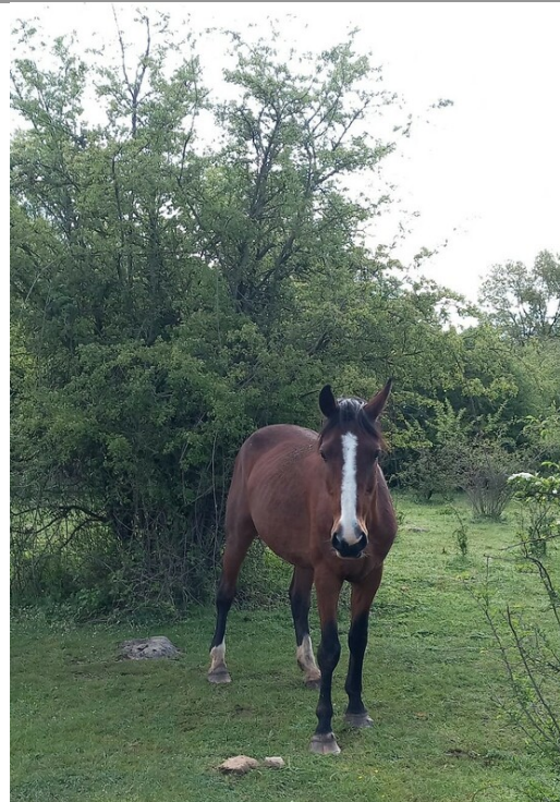
M.ZAGO DELLA NOCE DI CRETA