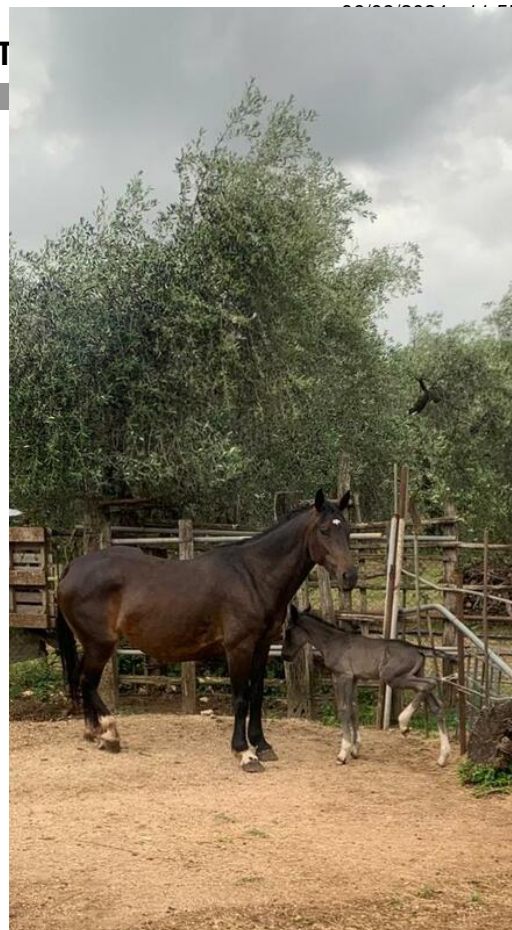
M.IPERICA DEL TALOZZO