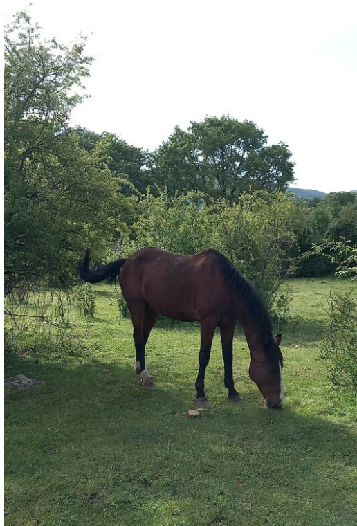
M.ZAGO DELLA NOCE DI CRETA